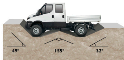
接近角 纵向通过角 离去角